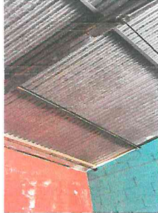
Foto1: Sustitución de lamina por lamina croquelada, en el area de la dirección y pintado de la estructura metálica.