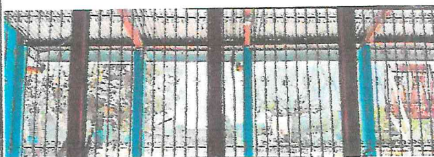
Foto 4: Mantenimiento de baranda de metal y mantenimiento a marcos de aluminio, sustitución de vidrios.