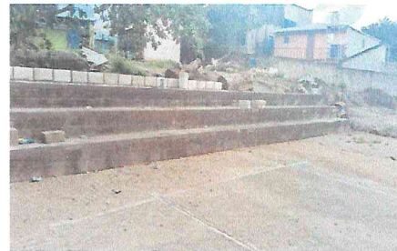
Foto 6: pegado de block, dos hileras para protección de la cancha, para que no se llene de agua.

Observación: Si es necesario se pueden agregar hojas adicionales y actualizar el número de hojas.