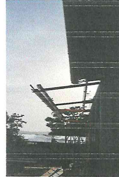
Foto2: Colocación de lámina croquelada, en el frente de la dirección.