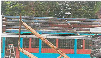
Foto 3: Sustitución de lamina por lamina croquelada, de dos aulas.